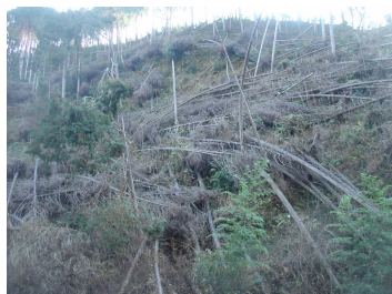
平成 20 年度