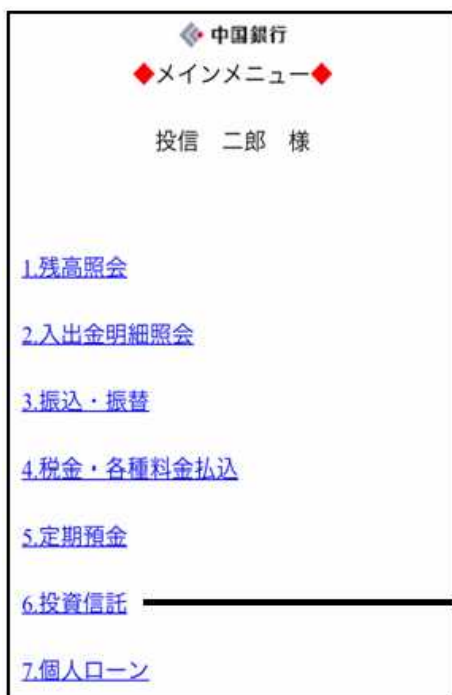
スマートフォンメニュー画面