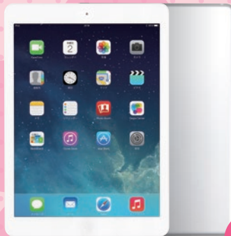
Apple i-Pad Air Wi-Fi シルバー (16GB)