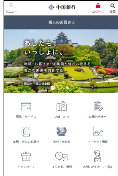
スマートフォン向け表示