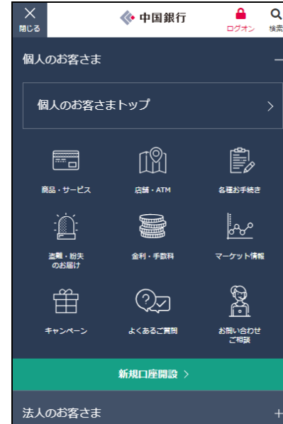
スマートフォン向け表示