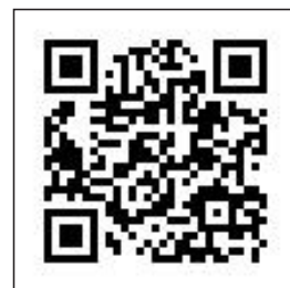
aula brand design HP