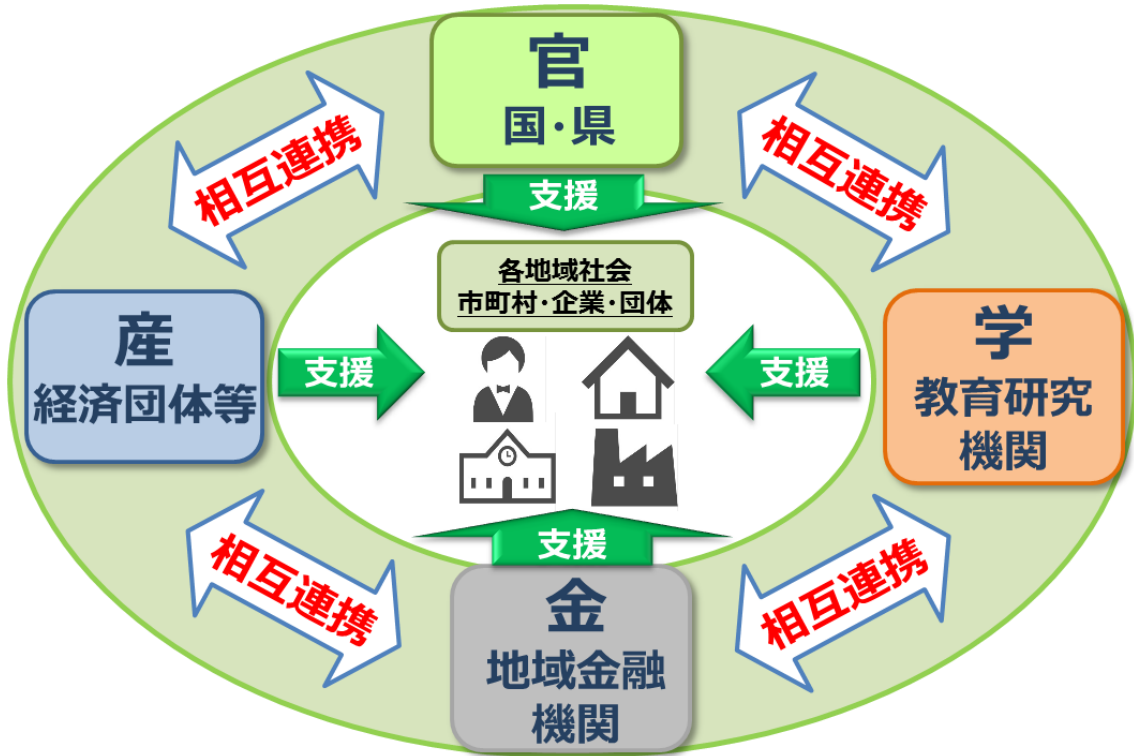
【コンソーシアムの取組み内容イメージ】