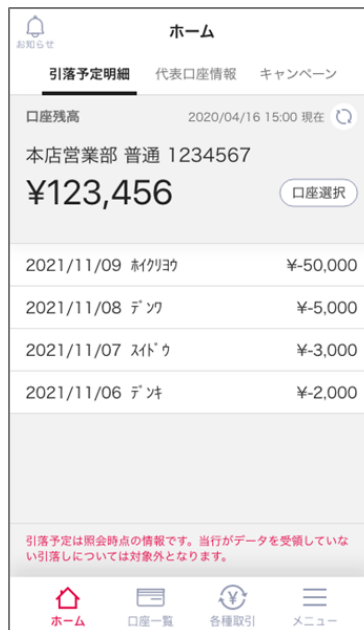
② 引落予定明細画面