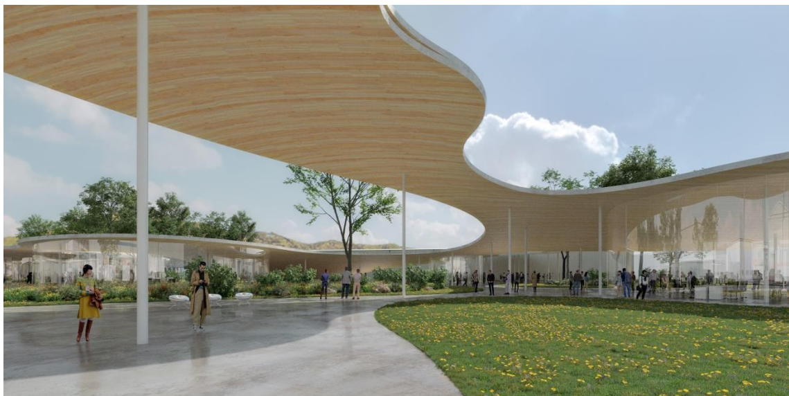
「Power Base イメージ」