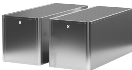
PowerX 定置用蓄電池「Mega Power」