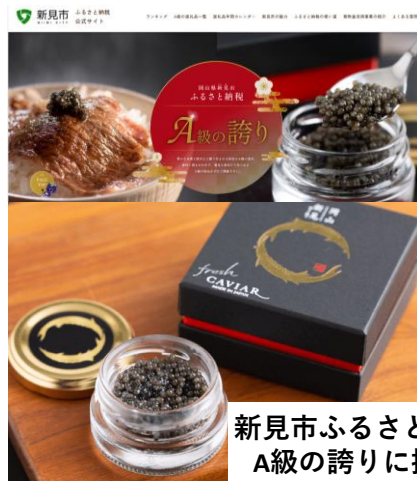
新見市ふるさと納税 A級の誇りに採用