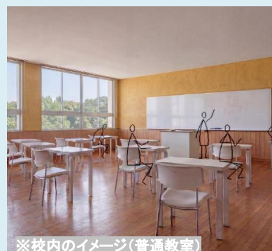
※校内のイメージ(普通教室)